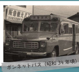
ボンネットバス (昭和34年頃)