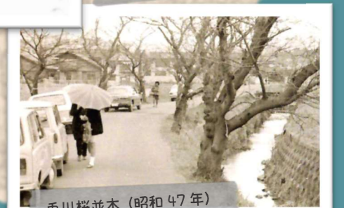
兔川桜並木 (昭和47年)