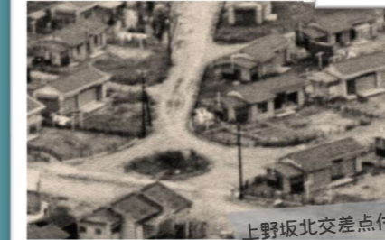
上野坂北交差点付近 (昭和32年頃)