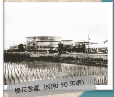
梅花学園 (昭和30年頃)