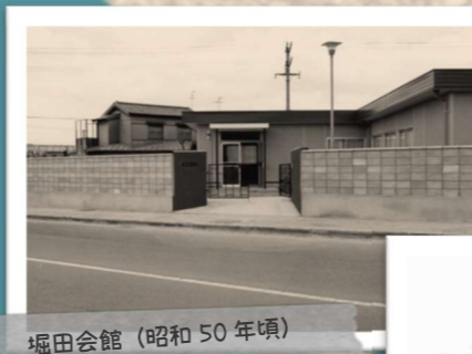
堀田会館 (昭和50年頃)