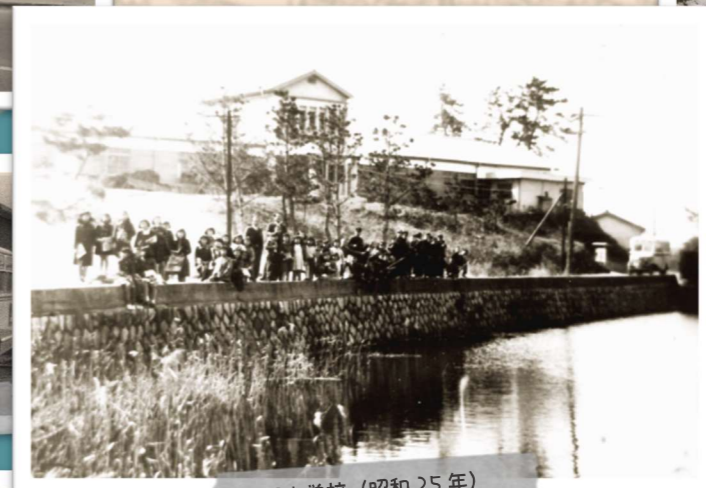
上野小学校 (昭和25年)