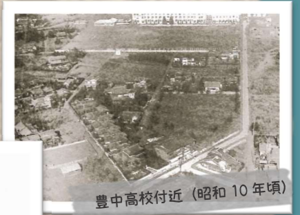
豊中高校付近 (昭和10年頃)