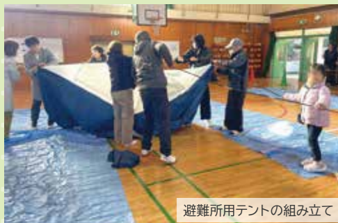
避難所用テントの組み立て