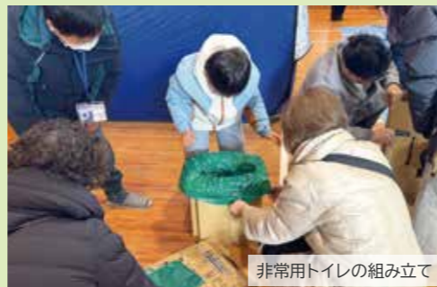
非常用トイレの組み立て