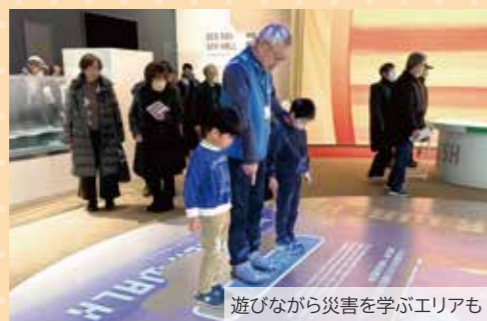
遊びながら災害を学ぶエリアも