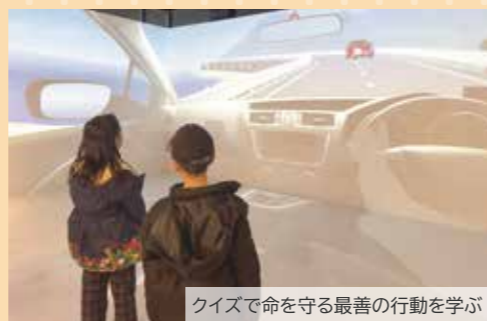
クイズで命を守る最善の行動を学ぶ