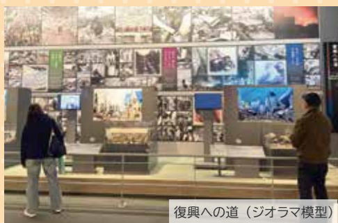
復興への道 (ジオラマ模型)

当日は吹雪く厳しい天候の中、朝早い集合にもかかわらず45名が参加。約2時間のモデルコースで東館と西館を見学し、震災当時の記録映像や体験型展示、防災・減災に関する最新の知識に触れました。