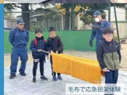
毛布で応急担架体験

今後も上野地域連絡会では、地域の皆さまが安心して暮らせるよう、防災活動に取り組んでまいります。