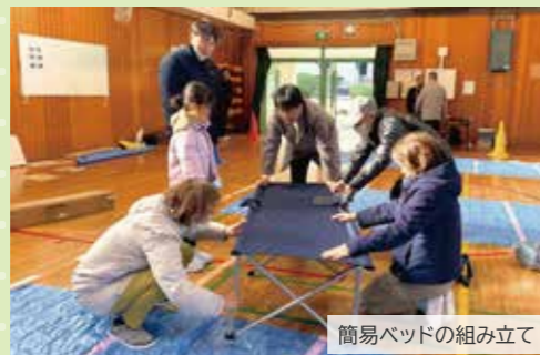
簡易ベッドの組み立て