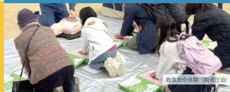
救急救命体験(胸骨圧迫)