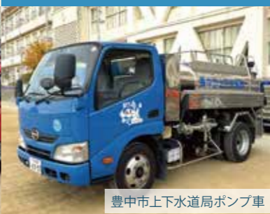
豊中市上下水道局ポンプ車