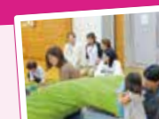
ほつとるーむひよこちゃん

部屋に空きがあれば、どなたでも利用できます。自治会員の方には割引制度もあります。ママ友同士の集まりやサークル活動、料理会などにも利用できます。まずはお気軽に、受付窓口へお越しいただくか、お電話にてご相談ください。