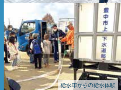
給水車からの給水体験