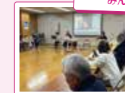
地域連絡会運営委員会

〒560-0011 上野西 1-11-33 ☎ 06-6848-4252 受付時間 10:00~16:00(月曜休館)