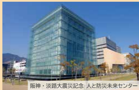
阪神・淡路大震災記念 人と防災未来センター