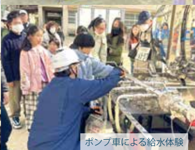
ポンプ車による給水体験